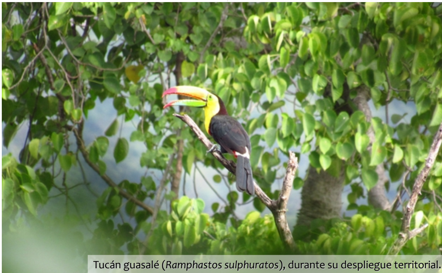
Tucán guasalé ( Ramphastos sulphuratus ), durante su despliegue territorial.