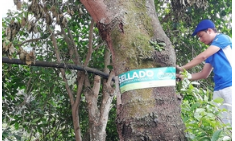
Funcionarios de Corpocesar, imponiendo los sellos en el bosque afectado.

Manaure, ha expresado a este medio que a pesar del impacto ambiental generado por la intervención, en la cual se observa el sendero ampliado mediante el uso de buldócer, con signos de remoción de la vegetación y del suelo, entre los grandes árboles de caracolí, que dan su nombre al sector.