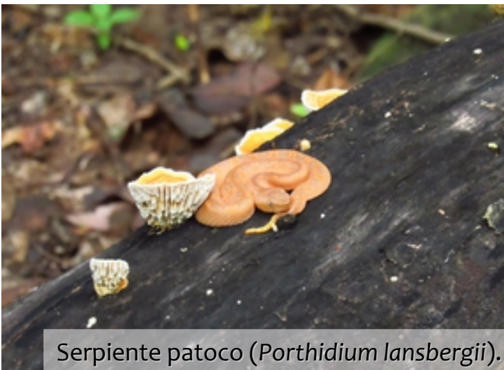
Serpiente patoco ( Porthidium lansbergii ).