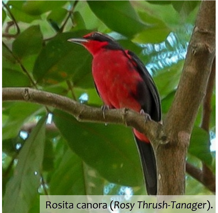
Rosita canora ( Rosy Thrush-Tanager ).