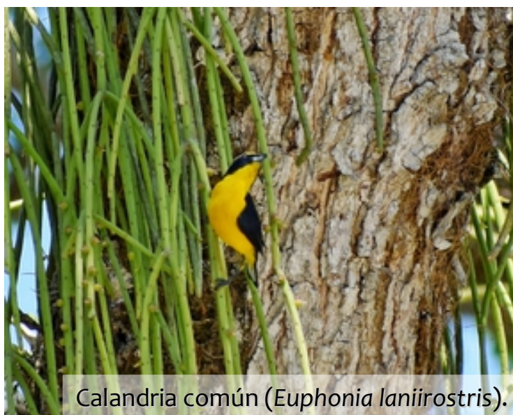
Calandria común ( Euphonia lanirostris ).

Muchas gracias por su aporte estimados pajareros del Cesar y felicitaciones por su entusiasmo en la práctica del birding amateur, que exalta la conservación ambiental, la libertad de transitar por los bellos parajes de nuestra nación y la admiración por las reinas de los cielos.