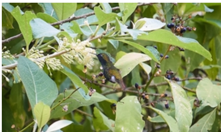
Esmeralda bronceada ( Chlorostilbon russatus ).