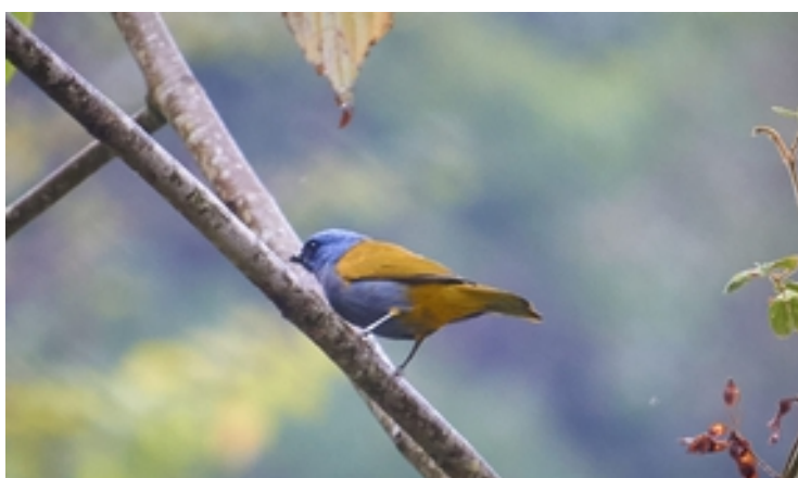
Azulejo montaño ( Thraupis cyanocephala ).

Muchas gracias por su aporte estimados pajareros del Cesar y felicitaciones por su entusiasmo en la práctica del birding amateur, que exalta la conservación ambiental, la libertad de transitar por los bellos parajes de nuestra nación y la admiración por las reinas de los cielos.