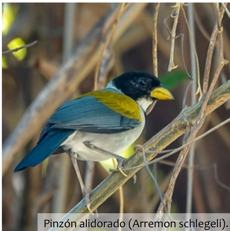
Pinzón alidorado ( Arremon schlegeli ).