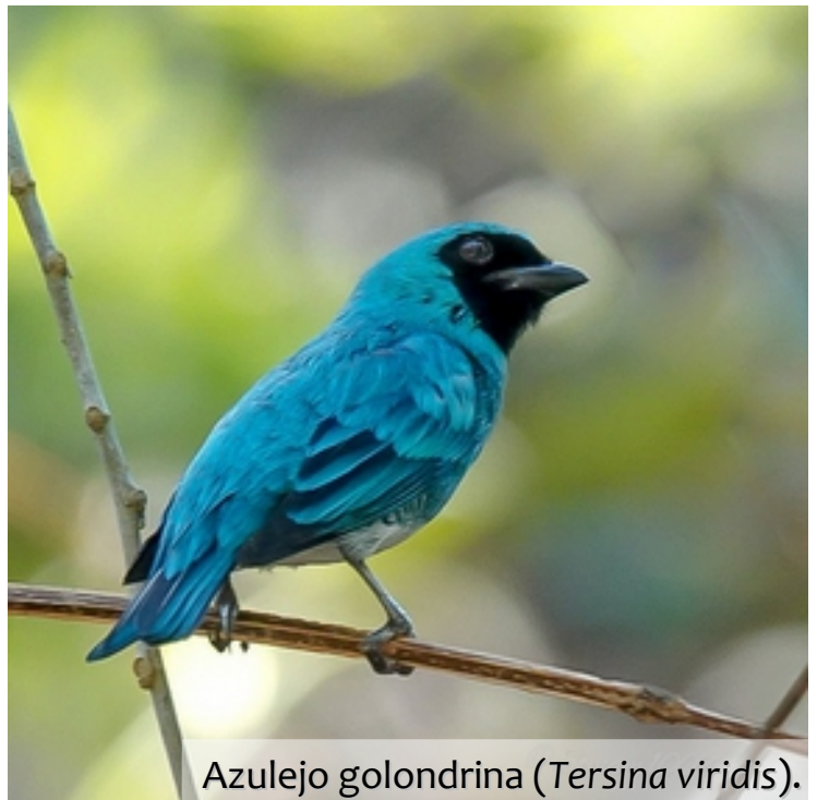
Azulejo golondrina ( Tersina viridis ).

compartió algunas de sus fotos tomadas durante una de nuestras jornadas preparatorias del Global Big Day, aquí podemos apreciar la rosita canora, la calandria común ( Euphonia lanirostris ). / Thick-billed Euphonia) y el espiguero capuchino ( Sporophila nigricollis ).