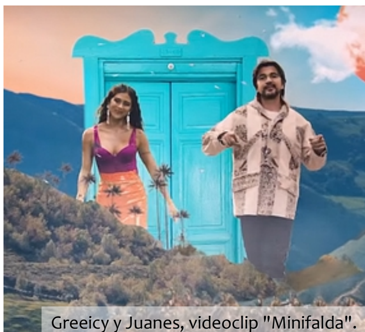
Greeicy y Juanes, videoclip "Minifalda".