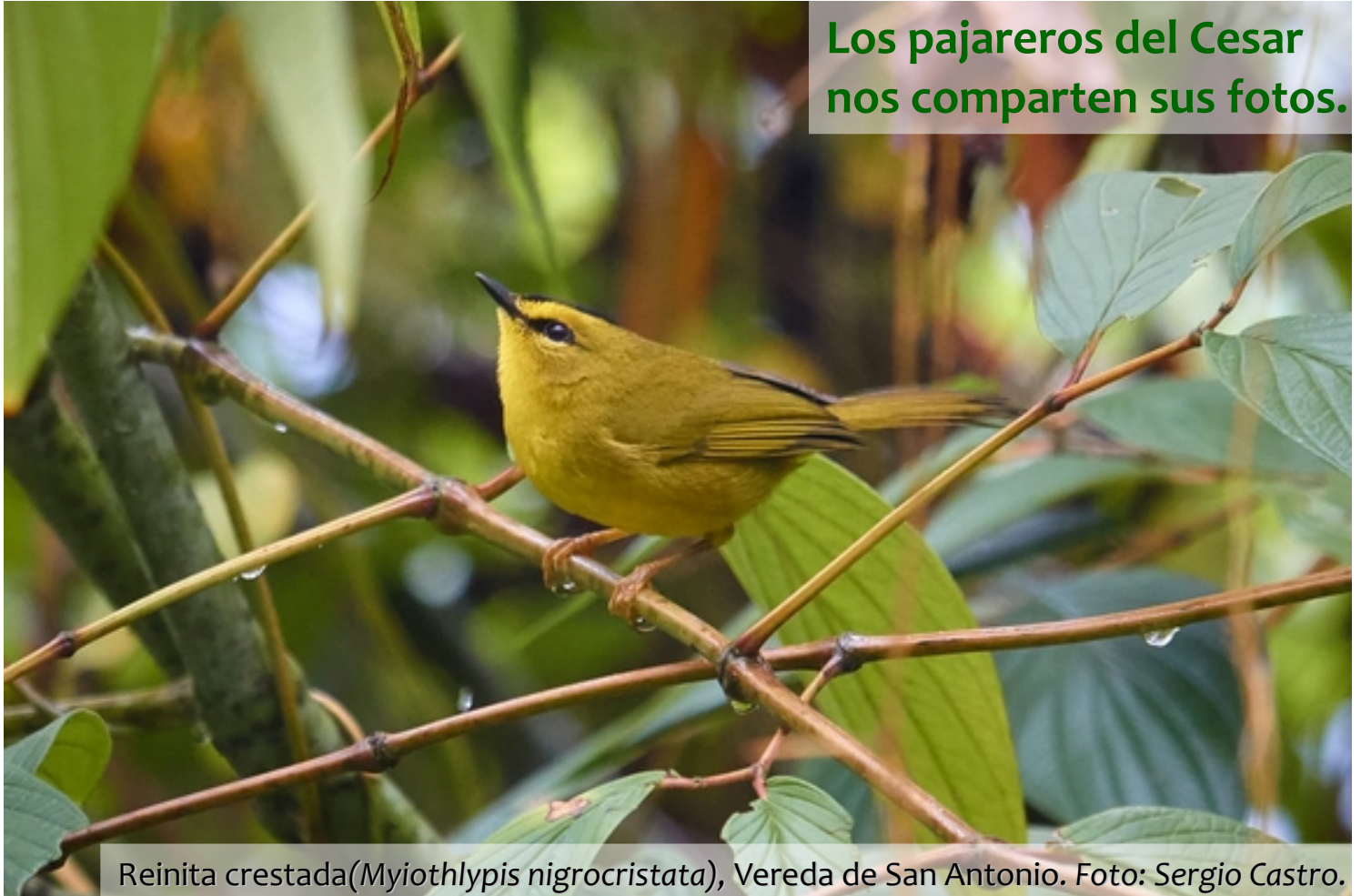
Reinita crestada ( Myiothlypis nigrocristata ), Vereda de San Antonio.

Informativo del Proyecto Ecojugando, año VIII, septiembre de 2019. www.roperoaventuras.com