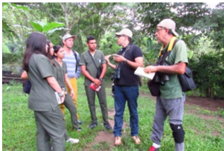
Con nuestros amigos, October Big Day 2018.

Si usted desea practicar el birding junto a este grupo de expertos puede enviar un email a roperoaventuras@outlook.com o llamar al teléfono +57 3176268212.