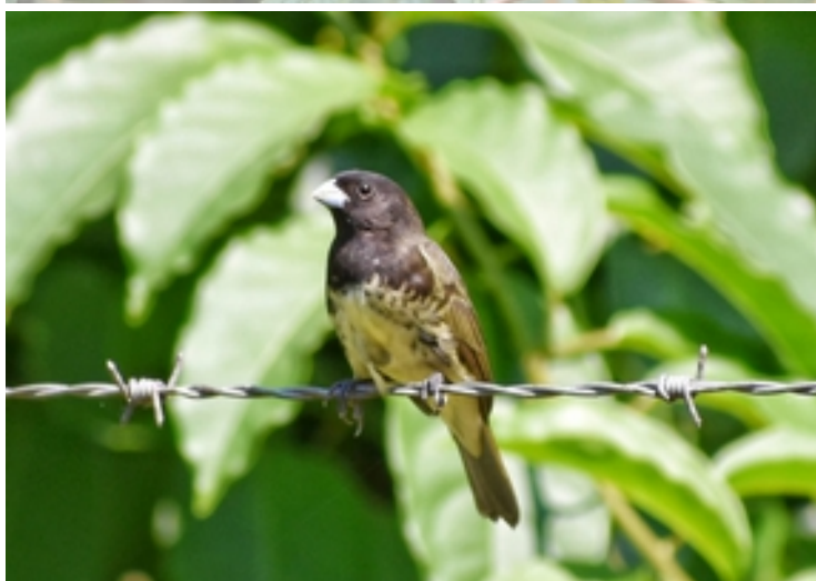
Espiguero capuchino ( Sporophila nigricollis ).