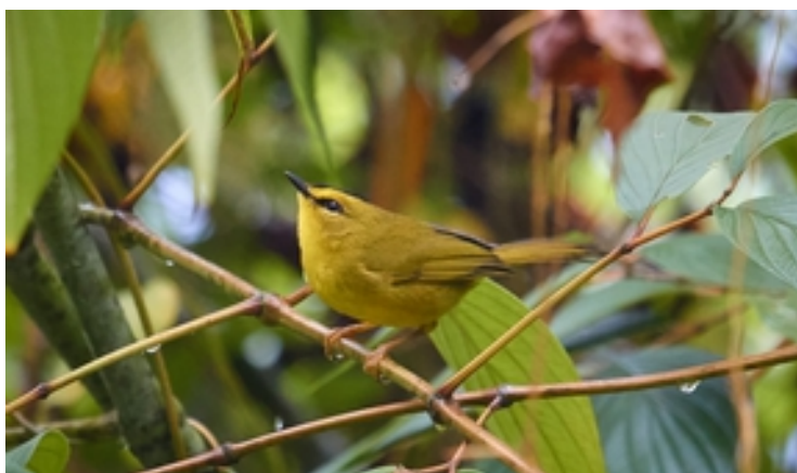
Reinita crestinegra ( Myiothlypis nigrocristata ).