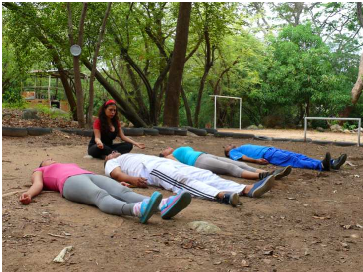
La relajación es parte esencial del yoga.