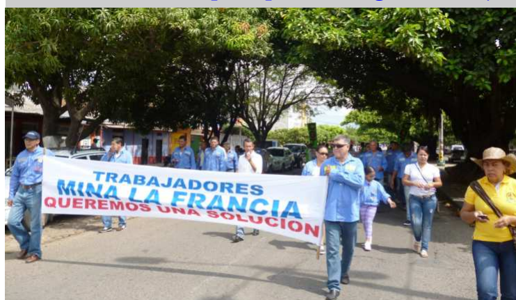
Aunque el cese de operaciones en la mina La Francia lleva más de 110 días, los obreros siguen firmes en la lucha. Aquí acompañando la marcha del 1 de mayo.