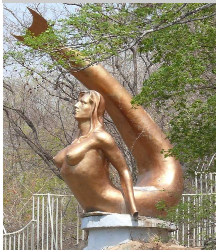
La queridísima Sirena Vallenata.