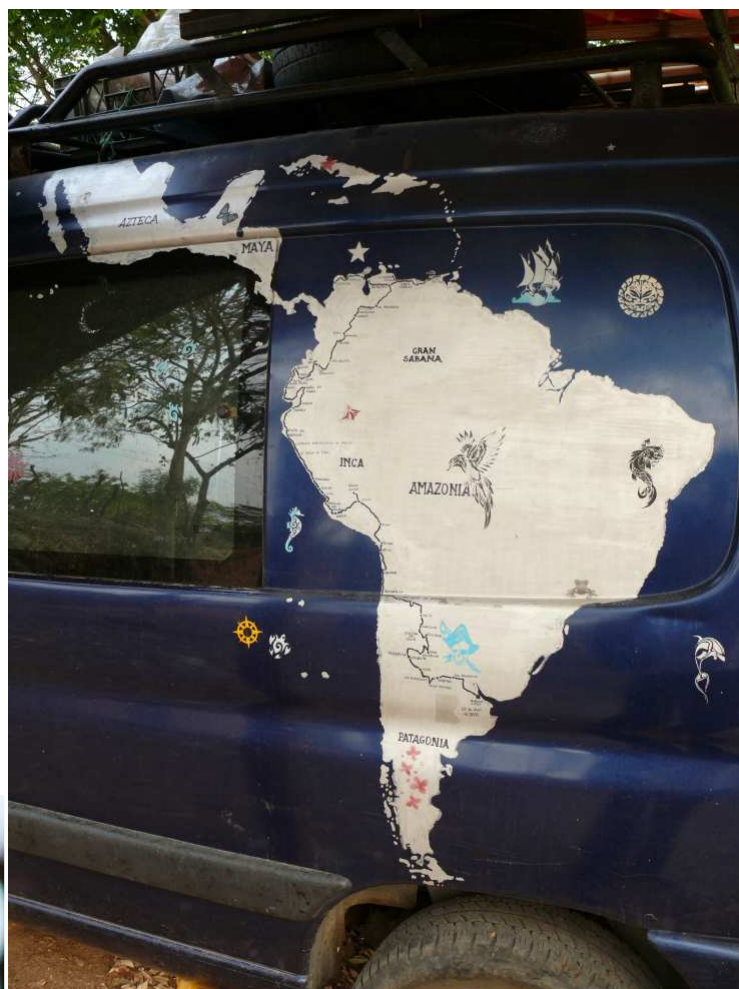
La van Peugeot, y el itinerario dibujado de esta peregrinación “indoamericana”.