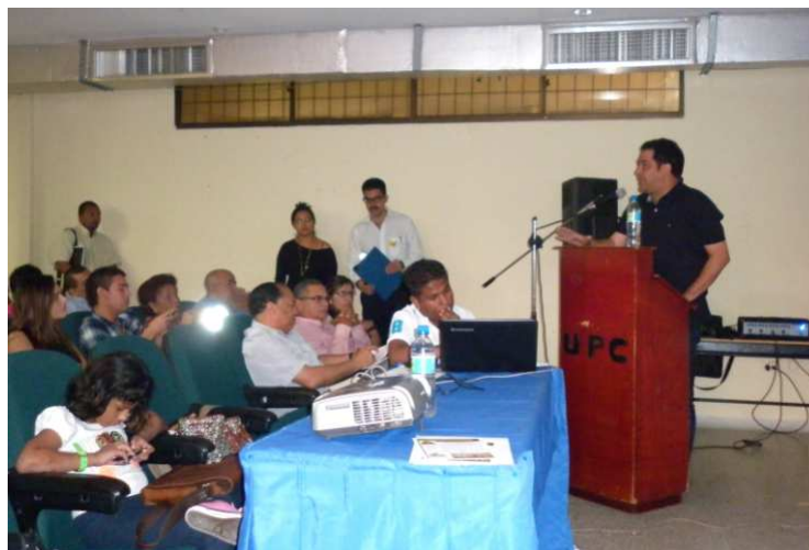
Foro “Efectos ambientales y socioeconómicos de la minería en el Cesar”. Auditorio IPS - UPC.

Buena onda deja la realización de estos foros en la universidad, un espacio crítico y creativo por excelencia, del que han salido los mayores descubrimientos e inventos de la humanidad, así como las grandes ideas de liberación y justicia social.