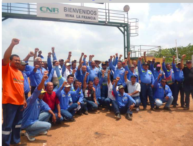
Los operarios de la mina La Francia exigen un trato digno y el respeto a sus derechos. En la foto se les ve custodiar la entrada principal de su lugar de trabajo.