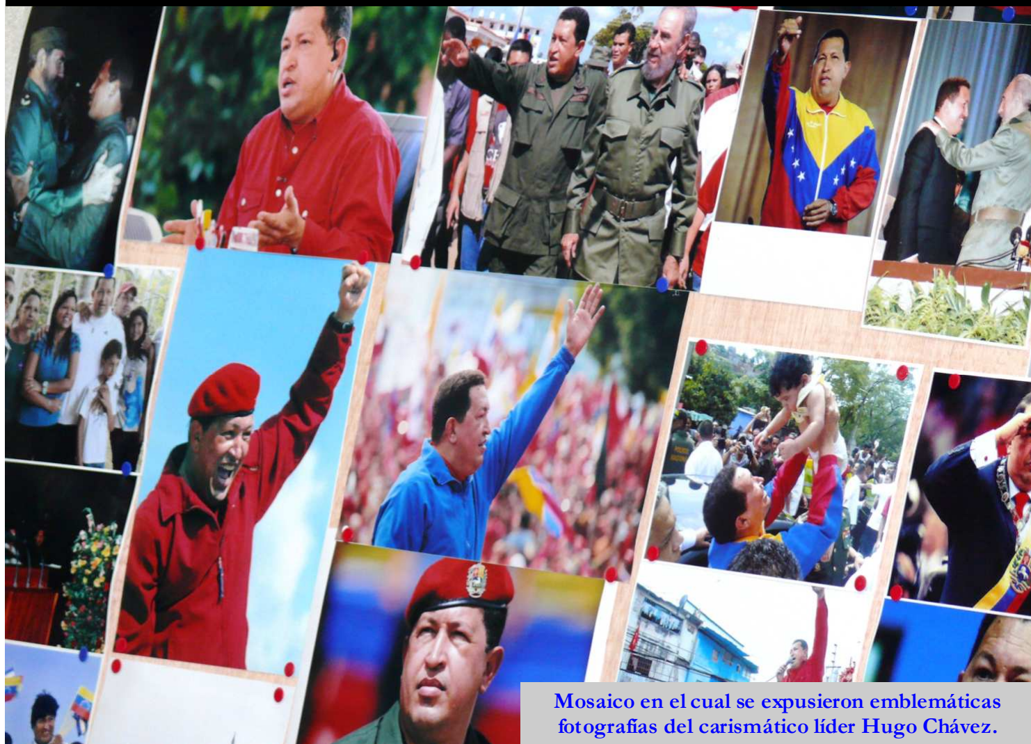
Mosaico en el cual se expusieron emblemáticas fotografías del carismático líder Hugo Chávez.

Autor: Redacción Ecojugando - Twitter: @ecojugando