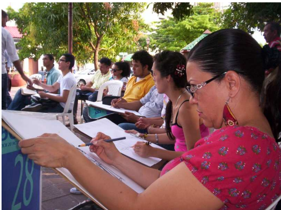
Jornada de dibujo realizada en el parque Las Madres, con la temática del happening

cuenta con presencia en diez ciudades de Europa y América.