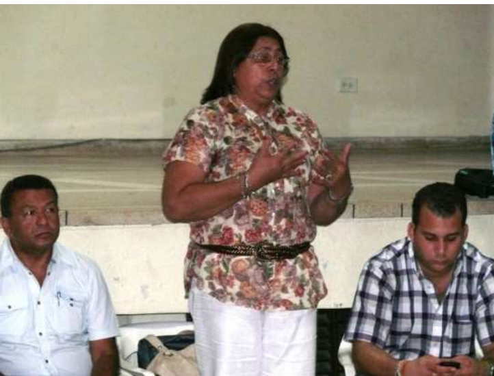
Presidenta del sindicato de Emdupar y algunos concejales de Valledupar durante la constitución del Comité Cívico.