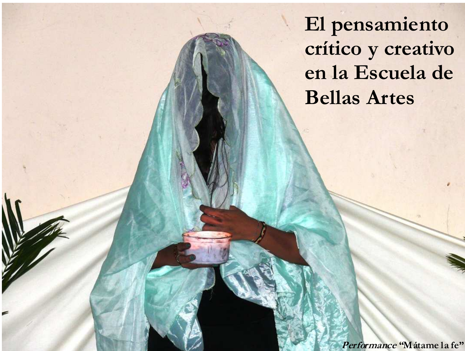
Performance “Mátame la fe”

Sueño y realidad, idea y materia, crítica y práctica, son las dualidades que hacen del cosmos una fuente inagotable de sucesos y un odre capaz de renovarse a sí mismo; el ser humano no escapa a esta dinámica de la vida, su mente es el resultado de una síntesis en la que imaginación y evaluación, derecha e izquierda, marcan los pasos del camino por recorrer; integrar armónicamente estos dos aspectos en la cotidianidad es esforzarse por construir el futuro deseado.