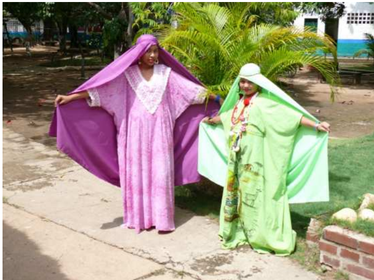
Atuendo wayuu. Muestra folclórica en el Liceo Moderno de Valledupar, durante el Festival Ecojugando

Por ahora podemos adelantarles que se realizará una “librotón” para dotar las bibliotecas de algunas escuelas de escasos recursos en Valledupar, desde ya puedes donar los libros que no uses en la dirección Carrera 19C1 # 13B-54 o llamando al teléfono 317 626 8212, responsable: Instituto Ecojugando.