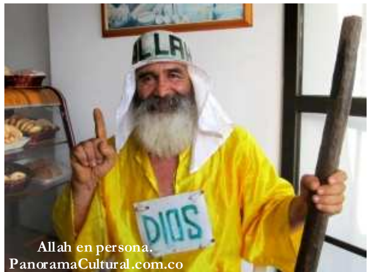
Allah en persona.