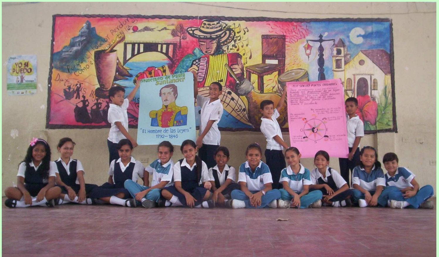
Estudiantes del Instituto Casimiro Raúl Maestre preparando sus ponencias para la Segunda Fiesta de la Ciencia Vallenata.

Valledupar, 12 de septiembre de 2012 - Número 4 - Periódico del Instituto Ecojugando ecojugando.wordpress.com - ecojugando@hotmail.com