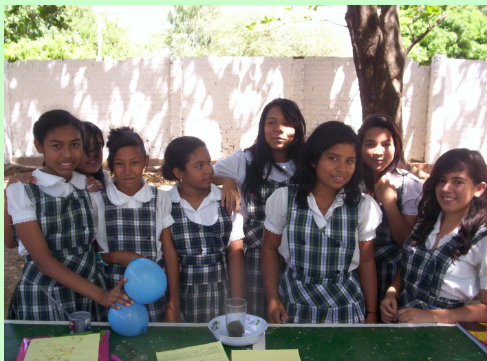
Estudiantes del Liceo Moderno haciendo experimentos