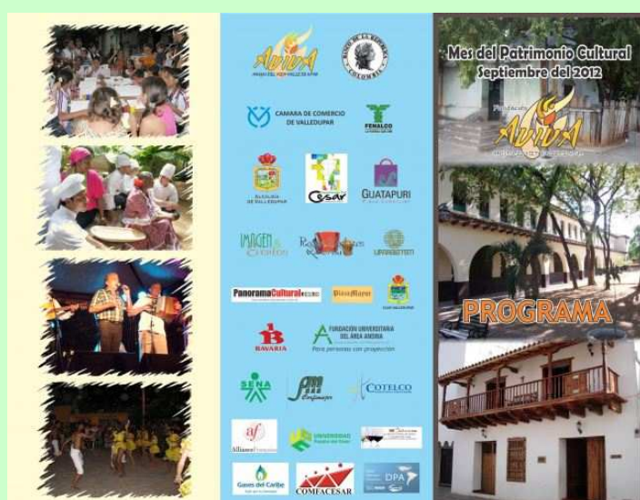
Plegable de "Septiembre Mes del Patrimonio Cultural 2012"