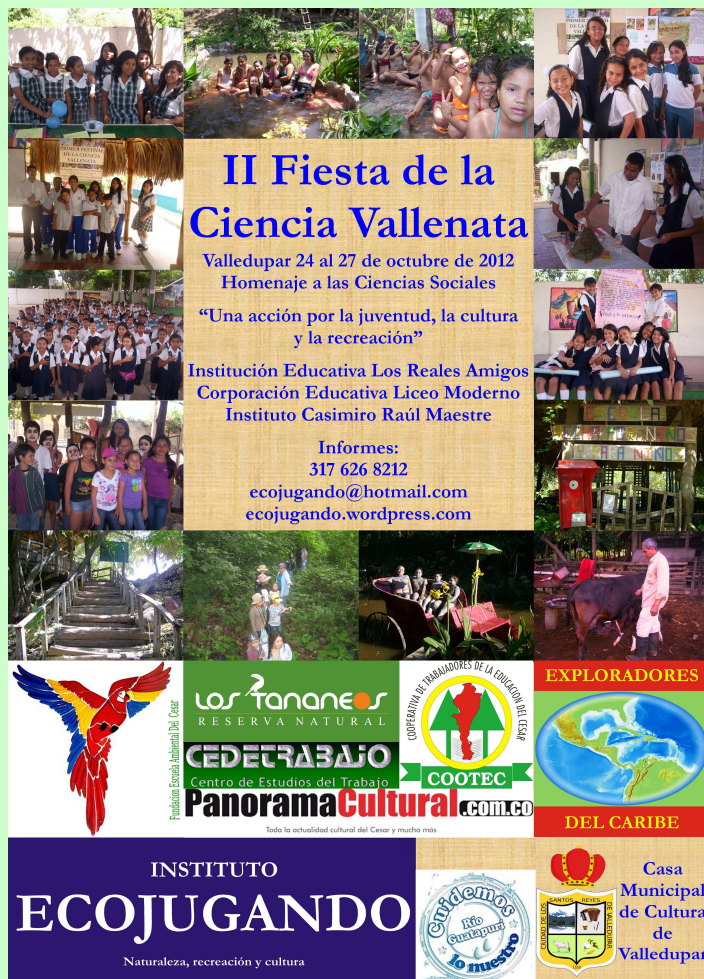
Póster de la II Fiesta de la Ciencia Vallenata

Valledupar, 12 de septiembre de 2012 Edición número 4