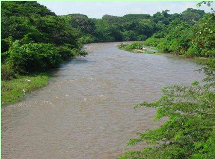
Río Ranchería a la altura de Fonseca - La Guajira

El río Ranchería es el segundo por su caudal entre los que nacen en las estribaciones de la Sierra Nevada de Santa Marta, recorre todo el sur de La Guajira y desemboca en el Mar Caribe bordeando la ciudad de Riohacha. Es el río de mayor importancia para los ciudadanos y la biota guajira, y el único que hidrata esas áridas tierras; de él depende la subsistencia de aproximadamente 600.000 personas, 50% de ellas perteneciente a la etnia Wayuu que aún practican la pesca artesanal y lo utilizan para el regadío en los cultivos de pancoger, principal fuente de los bastimentos con que se alimenta esta población, definitivamente se trata de un recurso vital e insustituible.