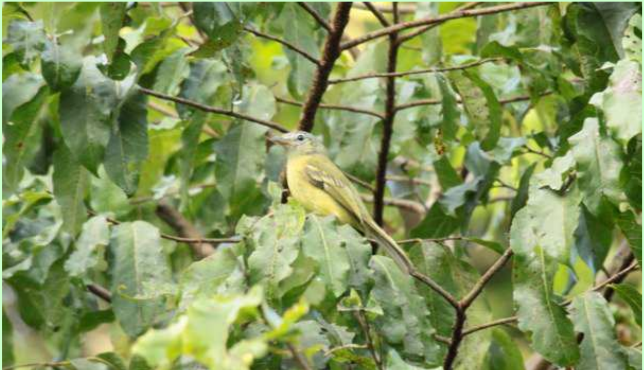
Fauna y flora de la Escuela Ambiental del Cesar.

El Jardín Botánico Vallenato nos da la oportunidad de comprender el funcionamiento del cosmos, no para memorizar y repetir, sino para pensar y crear, ahí está la clave del desarrollo humano. La pedagogía que implementamos en nuestro Jardín es de carácter lúdico, interactivo y productivo con énfasis en el trabajo colectivo, aprovechando las habilidades especiales de cada uno y aprendiendo a convivir con el respeto que todos nos merecemos.