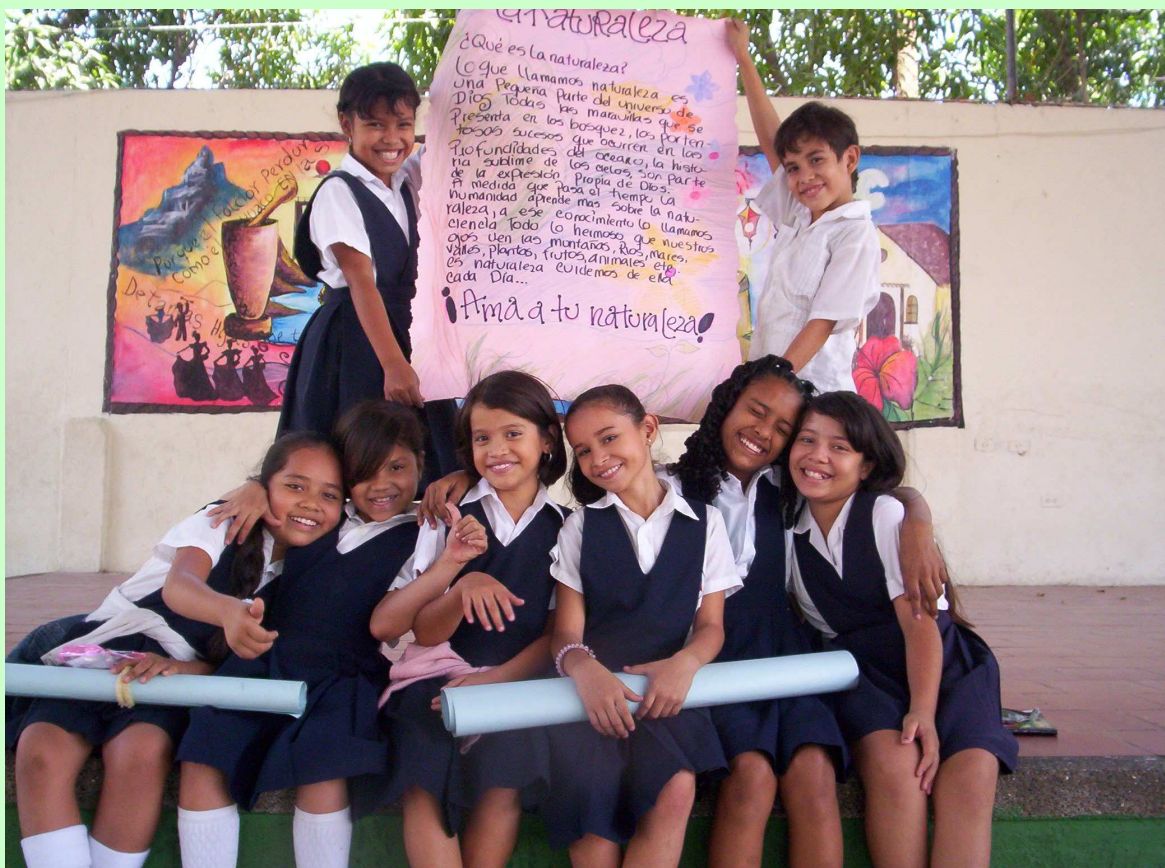
Estudiantes del Instituto Casimiro Maestre durante la Primera Fiesta de la Ciencia Vallenata, 23 de marzo de 2012.

La cultura es todo aquello que el ser humano es capaz de aportar al progreso de su comunidad. Hace muchos años, cuando las distancias y los obstáculos de la naturaleza eran insalvables podía considerarse la cultura como la expresión de un pequeño grupo social, pero hoy cuando tenemos medios de transporte y comunicación veloces y versátiles, los inventos y descubrimientos se conocen al instante en cualquier lugar del mundo, por tanto la cultura se ha hecho universal.