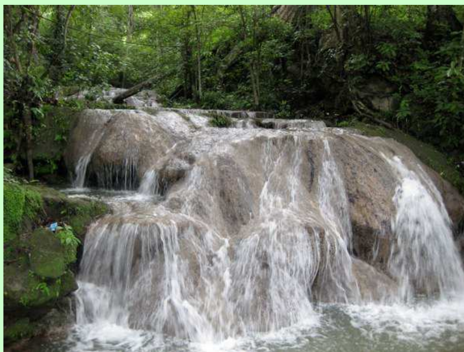
Reserva Natural Los Tananeos (Manaure Cesar)

El potencial turístico de la región vallenata es envidiable, en este lugar es posible encontrar todos los pisos térmicos, desierto, bosque, páramo, nieves perpetuas, biodiversidad, talento, juventud, riquezas agrícolas y minerales, todo lo necesario para diversificar la economía, y aunque el desarrollo ha sido disparado las oportunidades están precisamente en lo mucho que hay por hacer.