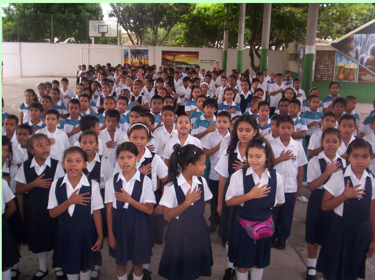
Estudiantes del Instituto Casimiro Maestre durante la inauguración de la Primera Fiesta de la Ciencia Vallenata.

En esta tarea el Instituto Ecojugando no está solo, la participación de la comunidad es trascendental, así es como los estudiantes de los colegios vallenatos preparan ponencias, experimentos y presentaciones artísticas dando vida a esta tarea, destacándose la Corporación Educativa Liceo Moderno y el Instituto Casimiro Raúl Maestre; además de otras instituciones destacadas en el área del medio ambiente como la Escuela Ambiental del Cesar y la Reserva Natural Los Tananeos.