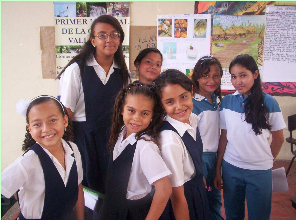
Ganadoras de los concursos de ponencias y experimentos.

Este evento es llevado a cabo dos veces al año, en los meses de marzo y septiembre, cada Fiesta de la Ciencia tiene una temática diferente, es así como la primera rindió homenaje a las ciencias naturales y la que se prepara para el mes de septiembre de 2012 tendrá por tema central las ciencias sociales.