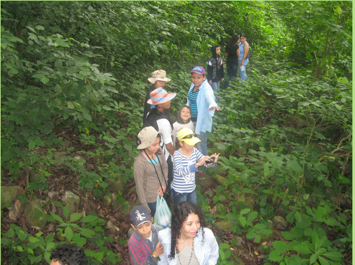
Exploradores recorriendo los senderos de la Reserva Natural Los Tananeos. Manaure Cesar, 20 de mayo de 2012.

Valledupar, 30 de mayo de 2012 – Número 2 – Periódico de la Corporación Ecojugando ecojugando.wordpress.com – ecojugando@hotmail.com